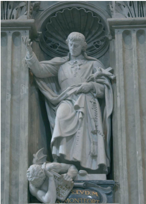
Saint Louis-Marie Grignon de Montfort (1673–1716)

Da san Paolo a san Luigi Grignon de Montfort, dalla Vandea alla Fraternità sacerdotale san Pio X, i preti conformati al Cuore di Cristo non sono "moderati", non si conformano alla "prudenza" del mondo; persino il loro equilibrio ed il loro autocontrollo scaturiscono dal caldo e travolgente amore per Dio.