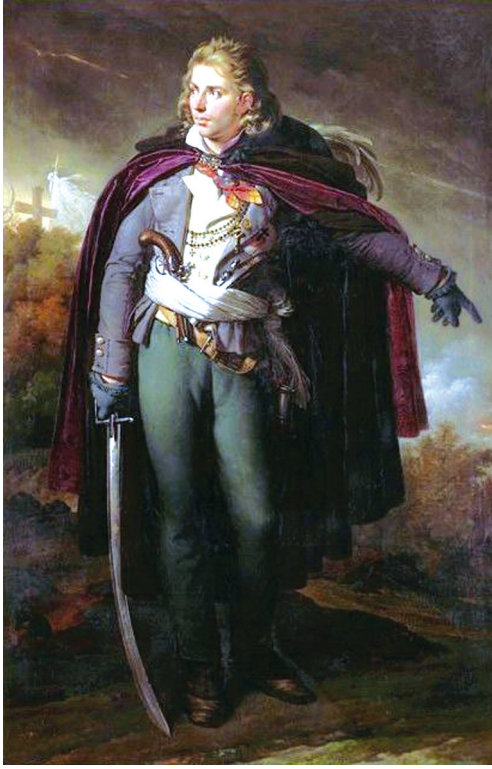
Il Generalissimo dell'Esercito Cattolico e Reale di Vandea, Jacques Cathelineau (1759-1793), noto come il Santo dell'Anjou

tutto vada in rovina? Tutto diverrà alla fine come Sodoma e Gomorra? Continuerai sempre a tacere e sempre pazienterai? [...]. Non hai rivelato, già da tempo, a qualcuno dei tuoi amici un futuro rinnovamento della Chiesa?».