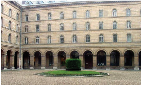
Cortile interno del Seminario di Saint Sulpice a Parigi

riuscire a sopportare fatiche, sacrifici e privazioni, e avranno la scioltezza e la destrezza dell'aquila per poter contemplare l'Onnipotente. «Tali saranno i missionari che tu vuoi mandare nella tua Chiesa. Essi avranno un occhio d'uomo per il prossimo, un occhio di leone per i tuoi nemici, un occhio di bue per sé stessi e un occhio d'aquila per te».