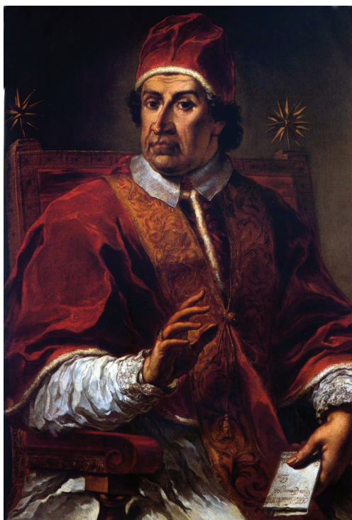
Giovanni Francesco Albani (1649-1721), Papa Clemente XI (1700- 1721)

cappelle e, nella Messa conclusiva, don Louis-Marie faceva rinnovare le promesse battesimali, come gli aveva consigliato papa Clemente XI (1649-1721), proponendo un «contratto di alleanza con Dio», che era una forma di consacrazione a Cristo per mezzo di Maria: tale contratto si firmava davanti all'altare; raccomandava poi la recita del Rosario e infine piantava una croce oppure faceva costruire un piccolo Calvario in un luogo ben visibile, come ricordo della missione stessa. E proprio in Vandea, regione francese che sarà teatro del primo genocidio della storia moderna 1 , fu protagoni-